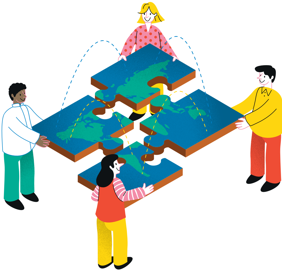
Maquette de couverture : Design Roman Vinçon et Nicolas Ruault Illustration de couverture : Designed by Freepik.