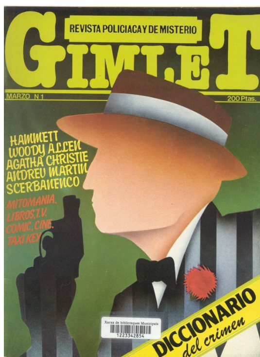
Imagen 1. Portada del número 1

Chandler nunca apareció como autor en Gimlet , pues, a diferencia de lo que sucedió con otros autores canónicos del género, jamás se publicó un cuento ni un artículo suyo.